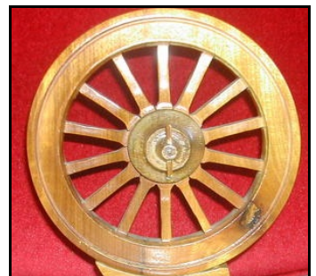
Realiteit / identiteit is die rim rondom. Speke is die verskillende aspekte van die alledaagse lewe. Geloof / die kruis is die as in die middel.

6+7. Wat is ons realiteit? En ek wil sommer byvoeg: wat is ons identiteit? - word ook bepaal deur die geskiedenis , hoe ons na die verlede kyk, wat is die kollektiewe kennis en verantwoordelikheid? En soos reeds aangedui: ons toekomsverwachting bepaal ons realiteit. Saam bepaal verlede en toekom ons hede; dit vorm ons gedagtes, ons besluite, ons verhoudinge.