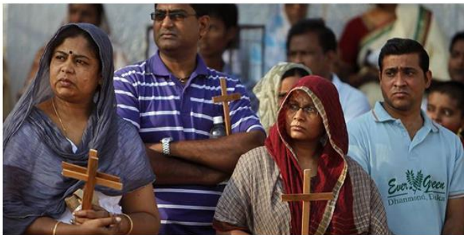
Immer wieder werden Christen in Indien Opfer von gewältätigen Übergriffen.